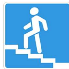
Надземный пешеходный переход